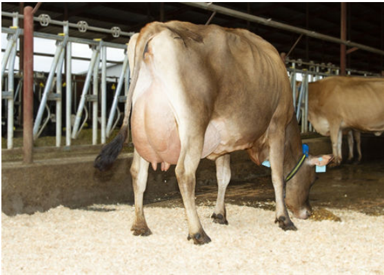
RACHELLES VICEROY LOUISE GRANDDAM